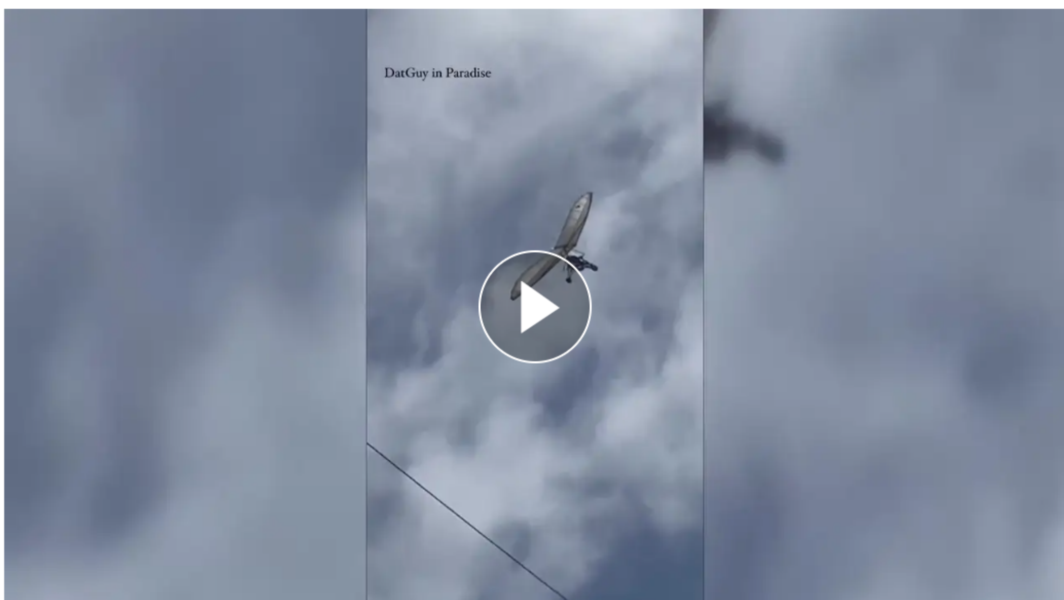
De Cuba a Miami, huida en ala delta

Dos cubanos huyeron del país en un ala delta. Realizaron un vuelo de 157,57km iniciado desde Tarará (Cuba) y aterrizando en Cabo Hueso (Miami, Estados Unidos). Los dos integrantes de la aeronave están en manos de las autoridades locales.